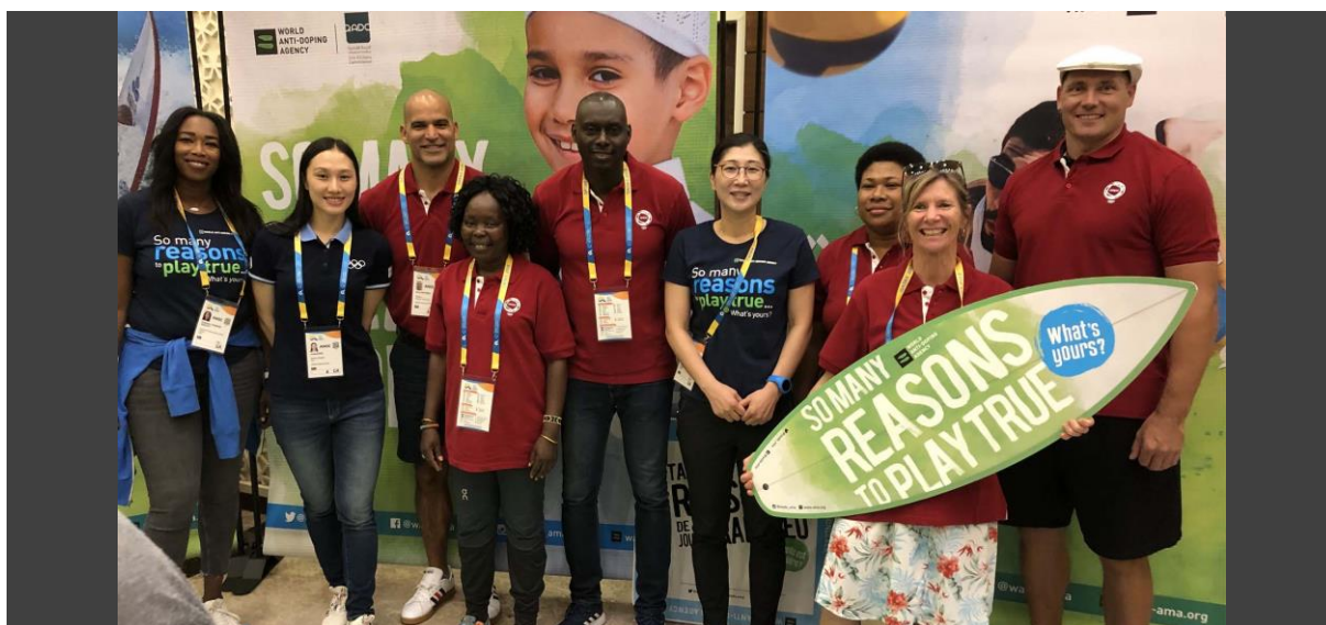
WADA's Outreach team engages athletes around Clean Sport during the 2019 ANOC World Beach Games in Doha, Qatar

In the face of the pandemic, I am proud to say that a lot has been achieved by the global anti-doping community. Testing and other activities have been back to normal levels since the start of 2021. This gave us the preparation time we needed for the Olympic and Paralympic Games in Tokyo.