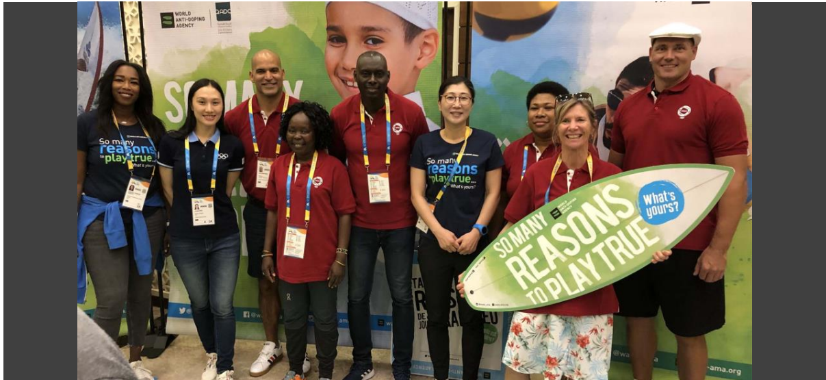
WADA'nın Sosyal Yardım ekibi Doha, Katar 2019 ANOC Dünya Plaj Oyunları esnasında Temiz Spor kapsamında sporcularla bir araya gelirken

Pandemi karşısında küresel dopingle mücadele topluluğu tarafından çok fazla şeyin başarıldığını onur duyarak söyleyebilirim. 2021'in başarılarıyla birlikte doping testi ve diğer aktiviteler normal seviyelerine dönmüştür. Bu bize Tokyo Olimpiyat ve Paralimpik Oyunlarına hazırlık süresi tanımıştır.