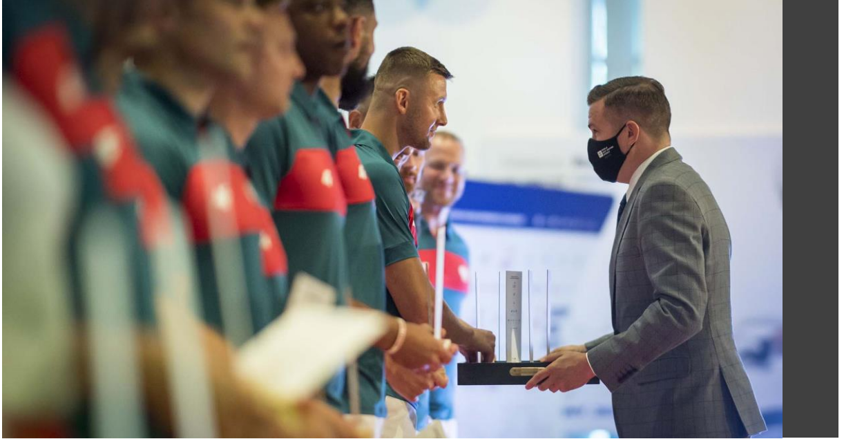
Witold Bańka, Polonya Olimpiyat Komitesinin Tokyo 2020 Oyunları yemin töreni esnasında Polonyalı sporcularla birlikteyken

WADA Küresel dopingle mücadele çalışmalarının düzenleyicisi ve denetçisi olarak büyük ölçüde soruşturma ve uyumlulukta kat edilen gelişmeler ve ayrıca gerçekleştirmiş olduğu geniş kapsamlı yönetim reformları sayesinde eğitim faaliyetlerini önemli derecede geliştirmiştir.